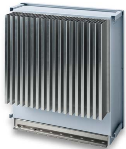
Äußerst robust: SINVERT PVM Wechselrichter verzichten auf externe Lüfter.